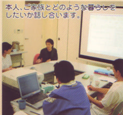
ケアカンファレンス